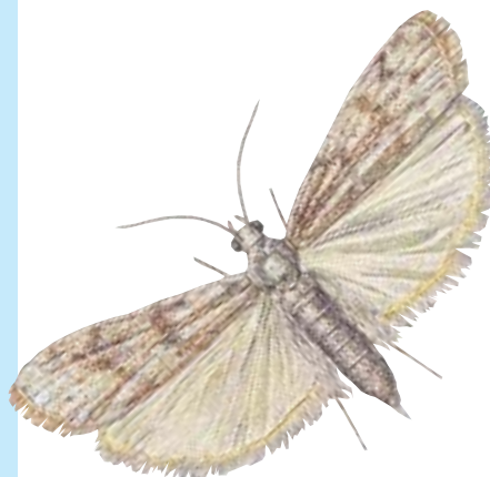
Pyrale méditerranéenne de la farine Envergure : 22 mm

Les mites peuvent se trouver dans une grande variété de produits stockés. Certaines espèces sont associées aux matières d'origine végétale, auxquelles elles peuvent s'être adaptées avec différents degrés de spécificité, tandis que d'autres sont associées aux matières d'origine animale et en particulier aux textiles.